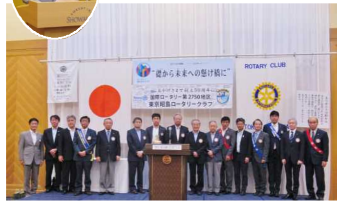
※次年度坂山年度の役員・理事・委員長・チームリーダー登壇 ※激励の拍手を会員皆様よりいただきました。