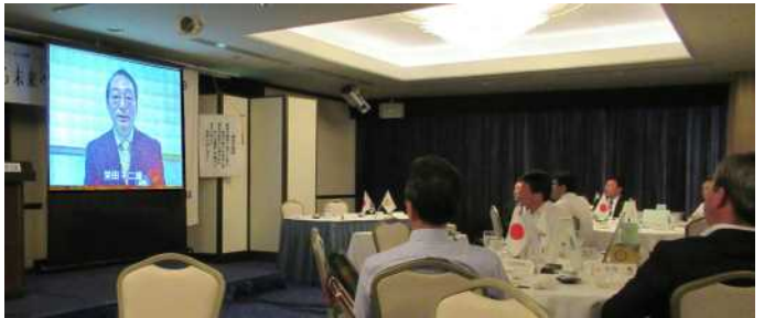
～「創立40周年記念式典」～ DVD上映

当日の場所は、昭島市役所市民ホールに設置してあります。モニター画面でカウントダウンしておりますが、当日6月30日が1120日から始まっております。モニターのバック画面は4種類あります。「つつじ・きんもくせい・ふじ・白画面」が5分ごとに変わる様になっています。表示される花は全て昭島市に因んだ花になっています。