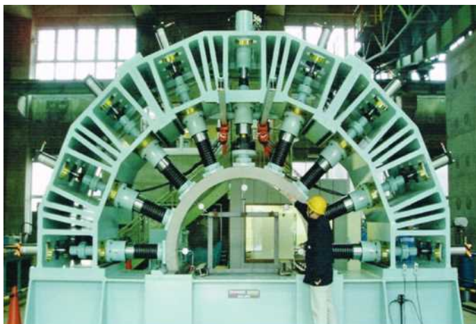
大型トンネル覆工模型実験装置 Large-scale tunnel lining model testing machine